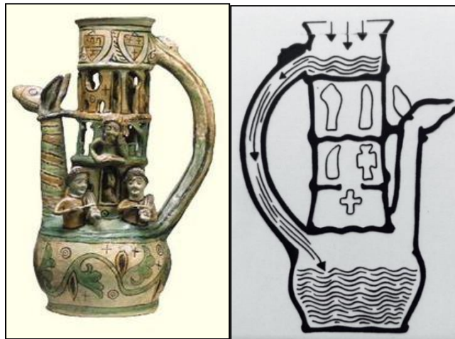
Görsel 1,2. Exeter Bulmaca Testi

Bulmaca testiler, masumca içki içenlerin içeceği üzerlerine dökmelemlerini sağlayacak şekilde tasarlanmışlardır. Ancak Exeter örneğinde, karmaşık görünmesine rağmen sıvı dökülmesine neden olan gizli delikler bulunmamaktadır. Bu örnekte üst hazneye akıtılan sıvı, içi boş olarak şekillendirilmiş kulptan aşağıya doğru akar ve emzik aracılığı ile dökülmeksizin boşaltılır (Okumuş, 2017: 329-342 ).