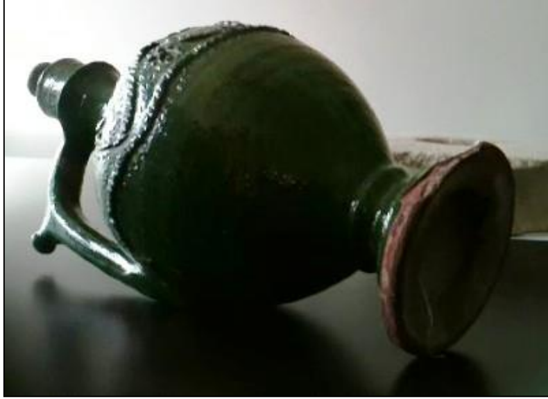
Görsel 23, 24. Çanakkale Arkeoloji Müzesi, Çanakkale Bulmaca Testi

Kullanım biçimleri ve dekorları geleneksel Çanakkale seramiklerinden farklı olan bu testilerin, form ve dekorları bakımından benzerlik gösteren örneklerinin Almanya Bavyera'da ve Balkan ülkelerinden Bosna-Hersek ve Bulgaristan'da da üretilmiş oldukları görülmektedir.