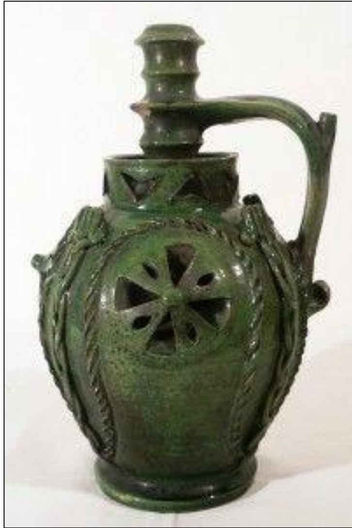
Görsel 25. Bavyera Kökenli Bulmaca Testi

Gövdesi, üzerinde emzik bulunan kulpu, boyun kısmı ve sır rengi bakımından Çanakkale Arkeoloji müzesinde bulunan bulmaca testi ile benzerlik gösterdiği görülmektedir.