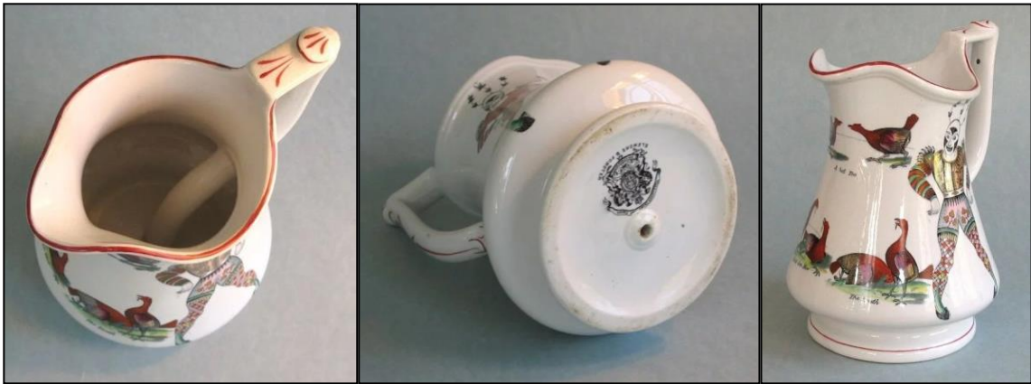
Görsel 5, 6, 7. Elsmore ve Forster Bulmaca Sürahi

İngiltere tarafından 1860 dolaylarında üretilen Elsmore ve Forster markalı bulmaca sürahilerde ise içi boş olarak şekillendirilmiş kulp, sürahinin içinden tabandaki deliğe bağlanmaktadır (Görsel 5, 6, 7). Sürahi dolu iken, kulpun üst kısmındaki delik parmakla kapatıldığında sıvı kulpun içinde tutulur. Parmak serbest bırakıldığında ise sıvı dökülür. Bu, bir pipetin üstünü parmakla kapalı tutarak bardaktan sıvı almayı sağlayan aynı prensiptir. Ondokuzuncu yüzyılda, barlar ve toplantılarda eğlence için kullanılmıştır. Sürahi, her iki tarafında da İngiliz palyaço, Joseph Grimaldi'nin bir temsili olduğuna inanılan, palyaço transferleri ile kaplıdır. Ayrıca, bir dizi horoz dövüşü sahnesi vardır (URL-4, 2018).