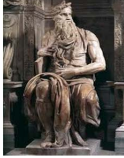
MUSA - Mikelanj

uygundur? Fotoğraf ya da yontu karşısında izleyiciler Mikelanjın sanallaştırdığı bir imgeye teslim olmuşlardır.