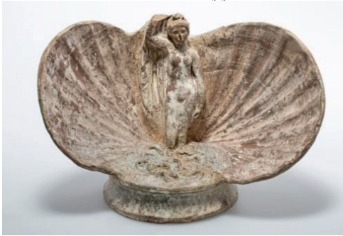
Figür 11. Aphrodite Anadyomene, Budapeşte Güzel Sanatlar Müzesi, MÖ 350-300