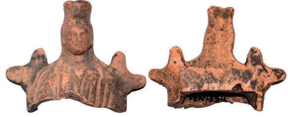
Figür 2. İznik Müzesi'ndeki 594 Env. Nolu Ana Tanrıça (Kybele) Figürünü, MÖ 4.-2. yüzyıllar

yüksek bir polos bulunan Tanrıça, dökümlü bir himation giymektedir. Elbisesinin kıvrımları ve dökümü de belirgin bir biçimde işlenmiştir.