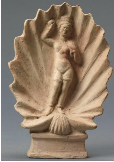
Figür 10. Aphrodite Anadyomene, Louvre Museum, MÖ 4-MS 1. yy

Müzesi'nde sergilenen diğer Anadyomene tipi örnekte ise tanrıça, kaide üzerinde çömelir vaziyette tasvir edilmiştir (Figür 12). Arkasında kanat biçimi oluşturan iki istiridye kabuğu bulunan figürinin beyaz astar boya ile kaplı olduğu anlaşılmaktadır.