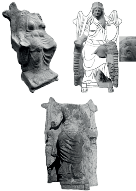
Figür 5. Olbia'dan Terrakotta Ana Tanrıça Figürinleri (Shevchenko 2019, s. 219 Fig. 1-2)