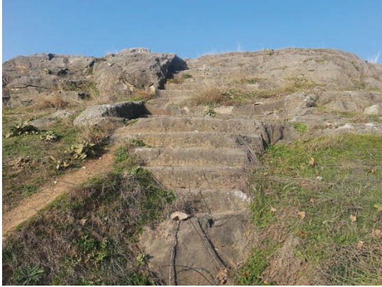
Figür 1. Merdivenli Kaya Kutsal Alanı/ İznik-Elbeyli (Karahan, Gedük, Konak 2022, s. 181; Karahan 2018, s. 53)

yerin, tanrıçanın kült alanı (Karahan, Gedük, Konak 2022, s. 181; Karahan 2018, s. 53) olarak kullanılmış olabileceğini düşündürmektedir. Bahsettiğimiz bu örnekler, Ana Tanrıça'nın Nicaea kentinde tapınımının varlığını kanıtlar nitelikte somut bulgular olmaları bakımından önem taşımaktadır.