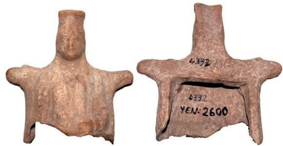
Figür 3. İznik Müzesi'ndeki 2600 Env. Nolu Ana Tanrıça (Kybele) Figürünü, MÖ 4.-2. yüzyıllar

2600 envanter numaralı Ana Tanrıça figürünü (Figür 3), ince mikalı, kırmızımsı sarı kil ile çift kalıp yöntemi kullanılarak, içi boş olarak şekillendirilmiştir. Figürünün yüzeyinde krem tonlarında astar boya kalıntıları görülmektedir. Çift kalıp yöntemi ile şekillendirilmiş ve arka yüzü ise düz bırakılmıştır. Arka yüzünde tam olarak belirgin olmayan, kare veya dikdörtgen formunda, olasılıkla büyükçe bir havalandırma açıklığı yer almaktadır. Bir taht üzerinde, oturur vaziyette betimlenmiş olan Kybele figürünü, belden aşağısı kırık olarak ele geçmiştir. Yoğun aşınma ve bozulma dolayısıyla figürünün yüz ayrıntıları belirgin değildir. Başında yüksek bir polos ve üzerinde himation bulunmaktadır. Tanrıça, sol elini ise karın hizasında yumruk biçiminde tutmaktadır.