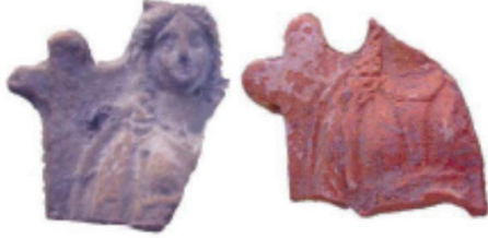
Figür 4. Metropolis'ten Terrakotta Ana Tanrıça Figürünü (Ekin Meriç 2013, Levha 2 TK 11-12)

15), Lesbos (Midilli Adası) (Αχειλαρα 2000, s. 231 Fig. 176-177-178, s. 334 Fig. 458) ve Euboea (Eğriboz Adası) (Childioglou 2015, s. 104 Fig. 14) gibi merkezlerde görülmektedir (Figür 4-5-6).