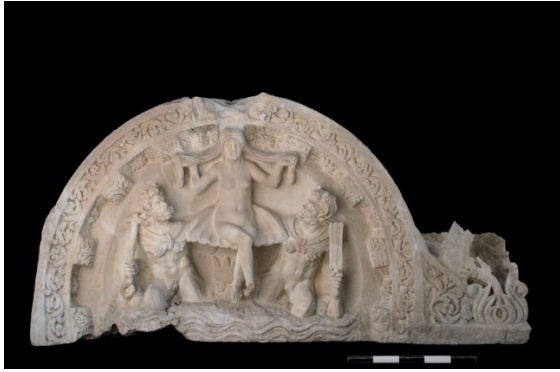
Figür 8. İstiridye Üzerinde Oturan Aphrodite (Aphrodisias Kazıları Alınlık Kabartması)