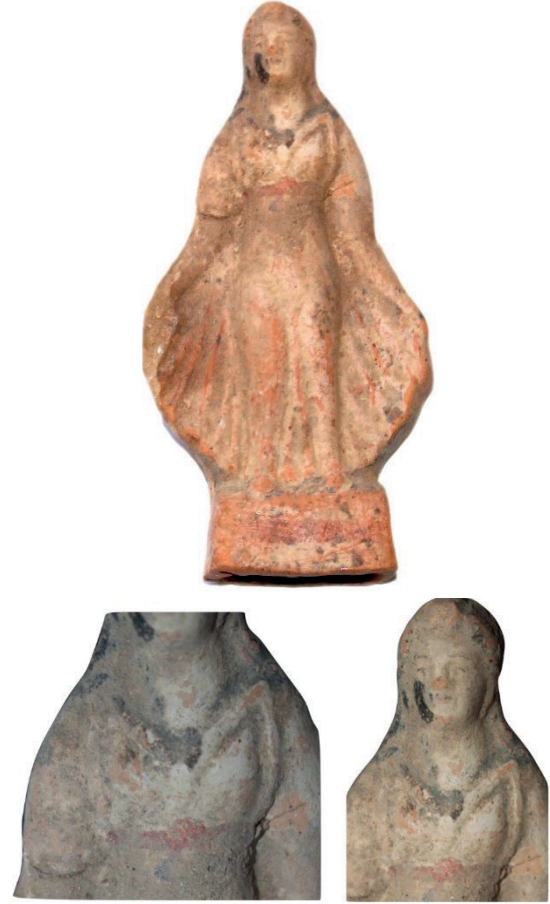
Figür 9a-b. İznik Müzesi'ndeki Aphrodite Anadyomene Figürini, MÖ 3.-MS 2. yy

kemer görüntüsü oluşturulmuştur (Figür 9a). Figürinin yüz hatları aşınma sebebiyle yeterince belirgin olmasa da kaş ve göz detaylarında boya kullanıldığı görülmektedir (Figür 9b).