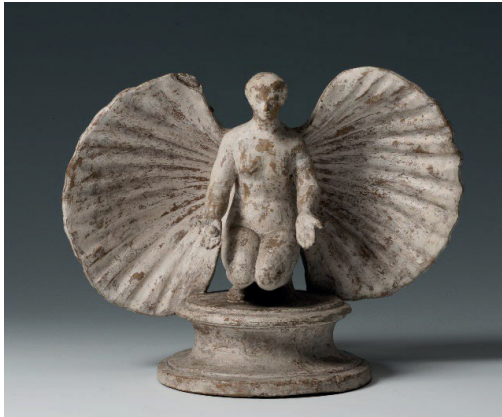
Figür 12. Oturan Aphrodite Anadyomene Hermitage Museum MÖ 3-2. yy

Figürinlerin üretim aşamasında, söz konusu eserde olduğu gibi kil rengi ve astar boyanın yanı sıra süsleme amacıyla, çeşitli bitkilerden elde edilen kök boya ile figürinleri renklendirme işlemi yapılırdı.