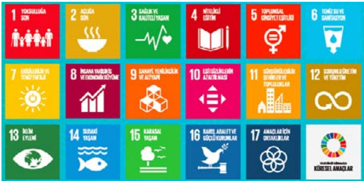
Şekil-1: Sürdürülebilir Kalkınma Amaçları (SKA)

Kaynak: SKA Pusulası www.sdcompass.org s.2.