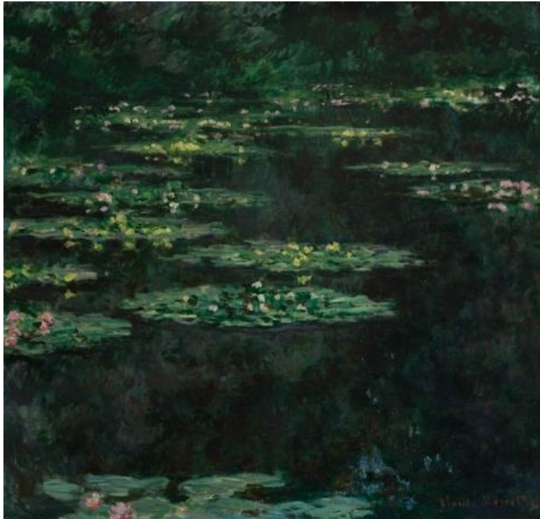
Resim 4: Claude Monet, Waterlilies, 89x92cm, 1904

Henüz hayatta iken resimleri sayesinde şöhret ve para sahibi olmuş Claude Monet (1840-1926) (Res. 4) ve Pablo Picasso (1881-1973) (Res. 5) gibi ressamlar, yaşarken hiç resim satmamış olsalardı; ne bu kadar çok iş üretebilir ne de biçim anlayışlarını bu kadar geliştirmiş olurlardı. Yaşadığı dönemde Monet de çok iyi kazanan ve saygı duyulan bir sanatçı olmasına rağmen; Picasso, popülerite konusunda bunun çok ötesinde ayrıcalıklı bir yer edinmiş ve 20. Yüzyılın 2. Yarısından itibaren örneklerini bolca görmeye alıştığımız 'Pop Star Sanatçı' türünün de ilk örneği olmuştur. Etrafını çevrelemiş hayran kitlesi, peşinden ayrılmayan basın mensupları ve foto muhabirleri, resimlerini satın almak için bekleyen koleksiyonerler ve tabii hayatına girmiş kadınlar; daha önce bir sanatçının bu yoğunlukta karşılaşmadığı şeylerdi. Bunların hepsini düşündüğümüzde, sanat camiasında magazin kültürü onun sayesinde oluşmuştur demek hiç yanlış olmayacaktır.