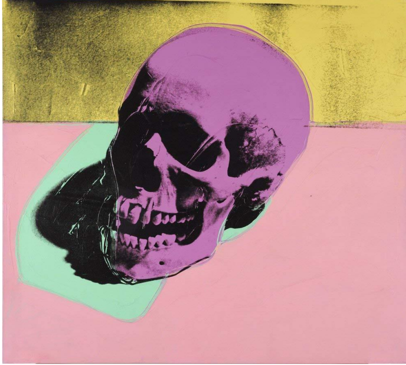
Resim 8: Andy Warhol, Skull, 192.4 x 96.5 cm, ipek-baskı, 1976

Yine Kuspit'e göre, "Kapitalizm büyük bir simyasal mucize gerçekleştirmiştir, çünkü sanatı paraya dönüştürerek sanatın, sonsuzluk adı verilen o nihai maddenin dünya üzerindeki temsilcisi olma rolünü geçersiz kılmıştır. İçinde yaşadığımız mahcubiyetten uzak materyalist döneme kadar, sanat dünya üzerinde sonsuzluğa en çok yaklaşan şey olmuştu, zaten kimi zaman "sonsuz şimdi" olarak da anılmasının nedeni budur" (Kuspit, 2006, s. 161).