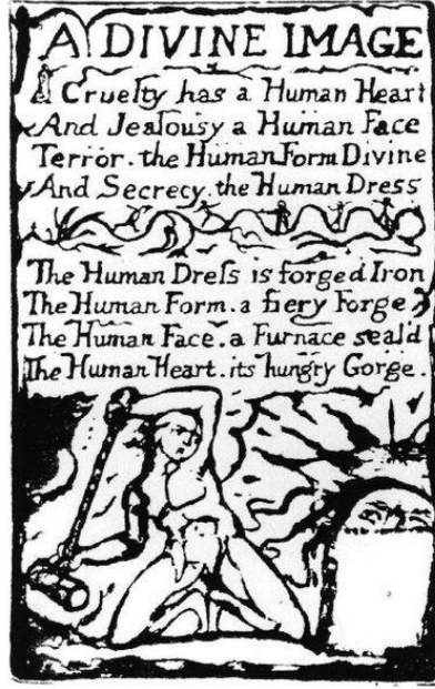
Resim 2: William Blake, 'A Divine Image', Songs of Experience, 1794

Blake'in mistik ve idealist bir mesih olduğu rahatlıkla söylenebilir. Fransız devriminin görece başarısızlığına rağmen radikal fikirlerinden hiç vazgeçmemiş; "Mind forg'd monacles" -Kelepçelerden yapılmış akıl- da bütün sınırları, mutlak otoriteyi, kralları hatta kiliseyi bile eleştirmiştir (Keynes, 1958). Sınırları olmayan sonsuz bir tasavvur dünyasıdır, Blake'in "Liberty Boy"unun gezindiği dünya. Karşıtların bileşkesinden doğan ve bakır levhanın sınırlarından taşan bu resimsel dünyanın merkezinde ise, insan bedeni ve figürün sonsuz devinimi vardır. Blake'in tasvirlerinden Michelangelo ve Raffaello'nun insan figürüne olan yaklaşımını, gotik aydınlatmayı ve hatta primitifliğini okuyabiliriz. "Eternal body of the man is the imagination"- İnsanın sonsuz bedeni hayal gücüdür- sözüyle Blake; hayal ederek ölümsüz bir formda varolunabileceğini, hayal kurulmayan bir dünyada ise, maddenin katı suretinden ve fiziki ölümden başka bir gerçeklik olmayacağını vurgular. İzleyenleri perde arkasındaki sahneye davet ederken, kendisi de Uzay Zaman'ın farkında olan bir mesih bir anlatıcı aktör haline dönüşür.