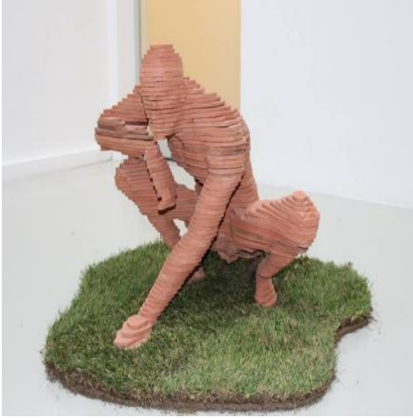
Resim 2: Koralp Türkoğlu, “Duo” 2016