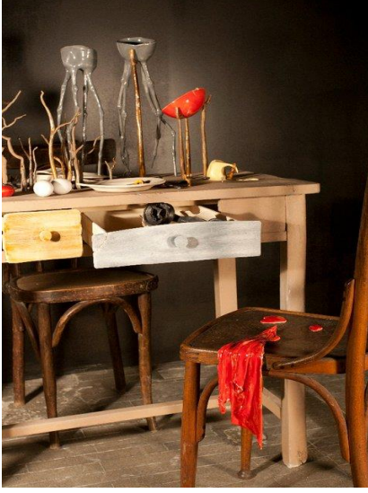
Resim 5: Elif Gündüz, “Dali’nin Sofrası”, 2011