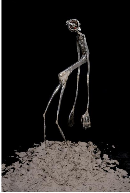
Resim 7: Burak Ayazoğlu, “Güç-İmha-Döngü”, 2014