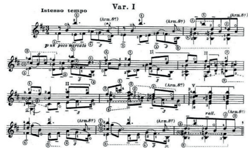
Görsel 5. I. Varyasyon

İki sekizlik ve üç sekizlikten oluşan ritmik karşılaşma p ve i, m ile dış partilerin hareketini oluşturur. Si sesinin armonik olarak seslenmesi ile hareket durdurulur. Varyasyon boyunca üç ve dört sesli akor yapıları içinde bastaki tema ve üçerli, ikişerli ritim gruplarına, si sesinin yarattığı pedal etkisi eşlik eder. Çalan için hareketli bir yapı hakimken dinleyici için sakinliği koruyan bir atmosferden söz edilebilir.