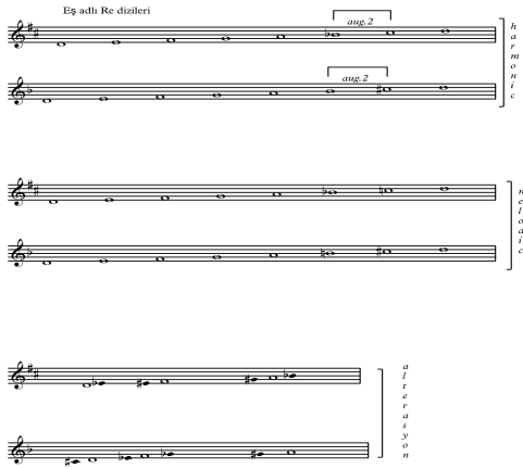
Görsel 9. Re dizileri

Eş adlı dizilerin kullanımı empresyonist sanat akımındaki puslu duyuş ve majör minör tonlarının geçişler ile sentezi zengin bir renk paleti oluşturur.