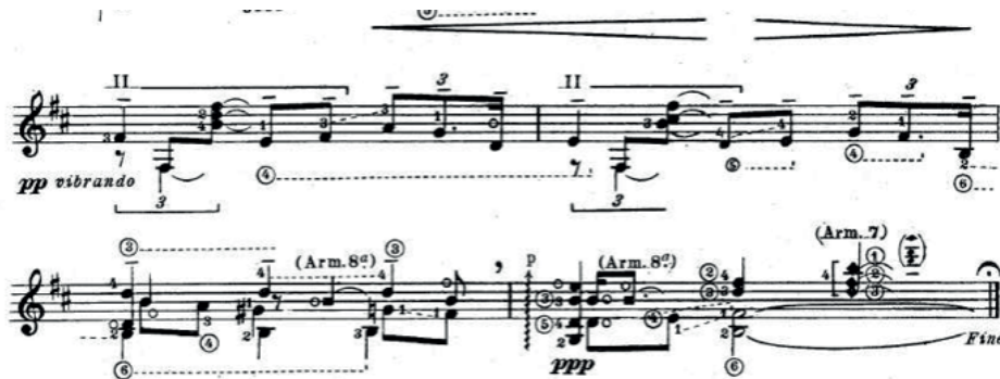
Görsel 12. VI varyasyon final ve temaya dönüş

TANSMAN, M. (2018). La guitare dans la vie d'Alexandre Tansman . Editions Habanera.