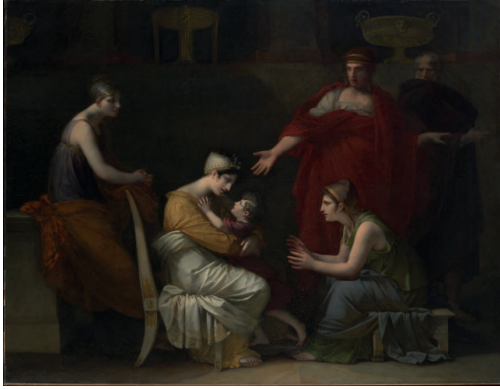
Resim 9. Pierre-Paul PRUD'HON, "Andromakhe ve Astyanaks", 1823

Konusu Fransız oyun yazarı Racine'den alınan eserde Andromakhe, oğluna bakmaktadır. Akhilleus tarafından öldürülen kocasının özelliklerini gördüğü oğlu Astyanaks'ı kucaklar. Anne ve oğul savaş ganimeti olunca Akhilleus'un oğlu Pyrrhus Andromakhe'ye âşık olur. Ancak Andromakhe'nin kocasına sadakatle bağlı olduğundan onu reddeder. Pyrrhus resimde gösterilen jestinden de anlaşılacağı gibi Andromakhe'nin tavrı karşısında şaşırmıştır.