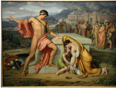
Resim 10. Johan Ludwig Gebhard LUND, "Pyrrhus ve Andromache Hektor'un Mezarında" 1807-11

Yukarıda yer alan eserde (Resim 10) Hektor'un mezarı başında ona sunularla bulunan Andromakhe ve oğlu Neoptolemos ile birlikte betimlenmiştir. Neoptolemos ganimeti olarak payına düşen Andromakhe'nin ölmüş kocasına olan bağlılığına anlam verememekte, onu kendine götürmek için acele etmektedir. Arka planda yanmış yağmalanmış Troya'dan göçenler kenti terk etmektedirler.