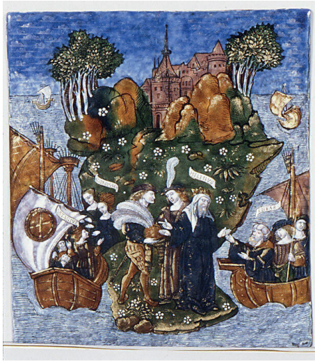
Resim 15. Master of the Aeneid, "Helenus ve Andromakhe Aeneas'a Armağanlar Veriyor" (Aeneid, Book III) 1530-35

Aeneid Ustası tarafından Bakır üzerine emaye boyalarla resimlenmiş kitapta, Aeneias destanından sahneler yer almaktadır. Bu parçada Butrotium'a ulaşan kahraman buranın yöneticileri olan Troyalı Helenos ve Andromakhe ile karşılaşır. Bu hikâye Andromakhe'nin öyküsünde detayı olarak açıklanmıştır. Sembolik bir anlatımda ve minyatür tarzında oluşturulan eser daha çok bir kitap resimlemesi olarak değerlendirilebilir. İlginçtir ki Andromakhe'nin resim sanatında sıklıkla konu edildiği sahneler; yaşantısının acı, dehşet ve çile dolu kısımlardan alınmıştır . Örneğin Hektor'un vedası ve ölümü, Astyanaks'ın öldürülüşü gibi, Andromakhe'yi dermansız acılarla yüzleştiren olaylar daha çok resmedilmiş konular olarak karşımıza çıkar. Bu emaye boyama plakada Aeneias akrabalarıyla vedalaşmakta, denize açılmak üzere bekleyen gemilerle tasvir edilmiştir.