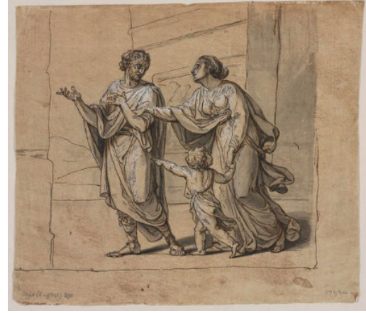
Resim 8. Jacques-Louis DAVID, "Andromakhe Hektor'un Yasını Tutuyor", 1783.