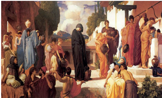
Resim 13. Fredric LEIGHTON, "Tutsak Andromakhe", 1888

Leighton'un "Tutsak Andromakhe" adlı eserinde, Hektor'un dul eşi ve Astyanaks'ın annesi Andromakhe siyahlara bürünmüş halde. O da