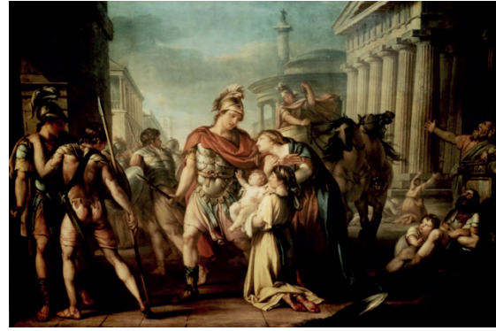
Resim 5. Gavin CRE HAMILTON, "Hector's Farewell to Andromache" 1775-80

Andromakhe'nin yer aldığı resimlerde özellikle de sahneyi erkek kahramanlarla paylaşıyorsa çoğunlukla destekleyici, yardımcı bir rol aldığı gözlenir. Bu kadının toplumsal yeri ve önceliğinin hep erkeğin gerisine konumlanması geleneğinin, Antik çağdan bu yana çeşitli biçimlerde süregelen olduğundan kaynaklanır. Euripides Andromakhe'yi bir kadın olarak idealize eder belki ama yine Andromakhe ağzından söylediği sözler kadının yeri ve konumu hakkındaki düşüncelerini ele verir.