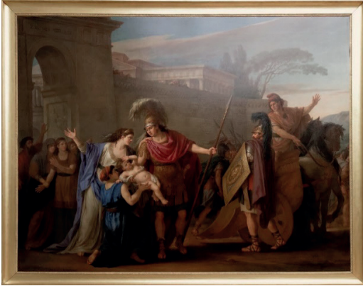
Resim 3. Joseph-Marie VIEN, "Hektor ve Andromakhe'nin Vedası", 1786

Avrupa resim sanatı geleneğinde Andromakhe'yi konu alan resimlerde çoğunlukla Troya savaşına ait eril imgelerin ve erkek kahramanın baskınlığı altında erimiş bir kadın figürü görmekteyiz. Bu durum konunun ele alınışını ve figürlerin resimdeki varoluşunu biçimlendirenin, resimlerin yapıldığı dönemin kabul görmüş toplumsal kalıplarından kaynaklı olabileceğini akla getirir. Vien'in yorumunda (Resim 3) Neoklasik resimlerin eserlerinde sıklıkla gördüğümüz erkek figürlere yüklenen vatansever, kahraman ifadelerinin yanında, kadın figürlerine yüklenmiş yoğun duygusallık göze çarpar.