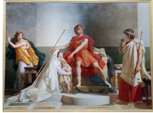
Resim 14. Pierre-Narcisse GUÉRİN, "Andromaque ve Pyrrhus", 1810

Klasik anlayışa dönmeyi hedefleyerek ve Antik Yunan ve Roma sanatını üstün tutan Neoklasikler, konularını da antik dünyanın ozanlarının eserlerinden seçiyorlardı. Bu bağlamda Andromakhe ve Pyrrhus (Neoptolemos'un diğer adı) tragedyalarda kendilerine geniş yer bulan karakterler olarak resimlere de tema oluşturuyorlardı. Guérin Neoklasik anlayışla ortaya koyduğu bu tabloda; Efendisi Pyrrhus'un huzurunda, kucagında çocuğuyla diz çökmüş Andromakhe, Orestes ve Hermione'yi dengeli ve geometrik bir kompozisyonda bir araya getirmiştir. Rönesans resmindekine benzer üçgen kompozisyon şeması resmin merkezine Andromakhe ve Pyrrhus figürleri ile yerleştirilmiştir. Hermione ve Orestes'in kompozisyondaki yeri, geri plandaki duvarın dikey bölümlenmeleri denge ve simetri sağlayacak şekilde planlanmıştır. Pyrrhus hanesindeki kadınları Orestes'in sorgulayan bakışlarından korumak ister gibi görünmektedir. Resimde Andromakhe ve çocuğunun beyazlar içinde gösterilmiş olmaları, onların masumiyetlerine yapılan bir vurgu niteliğindedir.