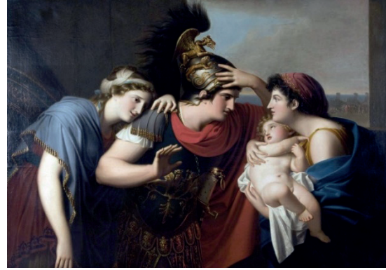
Resim 2. Gaspare LANDI, “Hektor ve Andromakhe'nin Buluşması”, 1794

Gaspare Landi'nin Neoklasik anlayışla ortaya koyduğu bu eserde (Resim 2), Antik Yunan heykellerine benzeyen figürler konu çerçevesinde bir araya getirilmiştir. Oğlunu ve karısını görmek için savaş meydanından dönen Hektor, kendisine özlemle yaslanmış Andromakhe ve dadısının kucağındaki oğlu Astyanaks'ın arasında durmaktadır. Küçük oğlunun korkuyla baktığını farkedince, aceleye tolgasını çıkarmak için hamle yapmıştır. Hektor'un dikkati oğluna yönelmiştir. Andromakhe ise kocasının omzuna yaslanmış duygusal bir ifadeyle durmakta, bakışları herhangi bir yerden öte iç dünyasına çevrili gibi görünmektedir. Arka planda Akhalara ait gemiler görünme ve savaşın gerçekliğini ve çok yakınlarında sürmekte olduğunu hatırlatmaktadır.