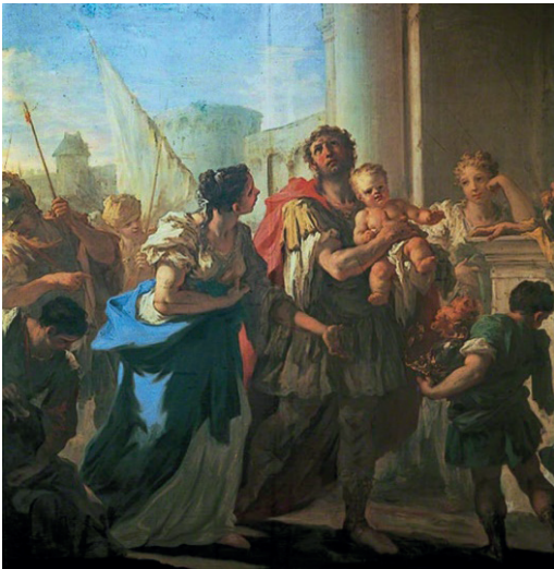
Resim 4. Giovanni Antonio PELLEGRİNİ, "Hektor ve Andromakhe", 1710

Pellegrini'nin eserinde kompozisyonun diyagonal hareketlerle kurgulandığı görülür ve bu yapı resmi dinamik hale getirerek durağanlığın önüne geçer. Resmin merkezinde Hektor, Andromakhe ve Astyanaks'tan oluşan aile yer almaktadır. Andromakhe ilgiyle kocasını izlemekte ve onunla konuştuğu yaptığı jestlerden okunabilmekte-