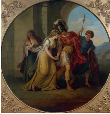
Resim 6. Angelika KAUFMAN, "Hektor ve Andromakhe'nin Vedası" 1768

Neoklasik tarzda portreler ve tür resimleri yapan İsviçre doğumlu bir ressam olan Angelika Kaufman, İngiltere'de bulunduğu yıllarda 1768'de Kraliyet Akademisi'nin iki kadın kurucu üyesinden biri olmuştur. Görülmekte olan resim (Resim 5) Troyalı Hektor'un savaşa giderken oğlu ve karısı ile ayrılış sahnesini konu almaktadır. Hektor oğluyla vedalaşmış, Andromakhe'den de ayrılmak üzeredir. Karı kocanın birbirlerine sevgiyle yaklaşmış oldukları beden dillerinden okunmaktadır. Ancak Hektor harekete geçme kararlılığıyla adımını attığı görülür. Kaufman 1768'de bu konuyu ele aldığı hem bir, hem de desen çalışması yapmıştır. (Resim 6) Ancak iki çalışma kompozisyon açısından farklılık göstermektedir. Figürlerin yönü iki resimden birbirinden farklıdır, Hektor tüylü bir miğfer ve kırmızı bir tunik giymektedir ve çocuk ikinci bir kadın figürü tarafından tutulmaktadır. Hektor'un mızrak ve kalkanını tutan bir yardımcı görünür. Kaufman veda sahneleriyle ilgili başka çalışmalar da yapmıştır. Konunun sanatçıyı Andromakhe özelinde olmasa da ilgilendirdiği açıktır. Ayrıca Kaufman; desen gücü, ışık-gölge etkileri ve duyarlı fırçasıyla bir ressam kadın olarak kendini kanıtlamıştır. Sanatçı Andromakhe ve Hektor'u