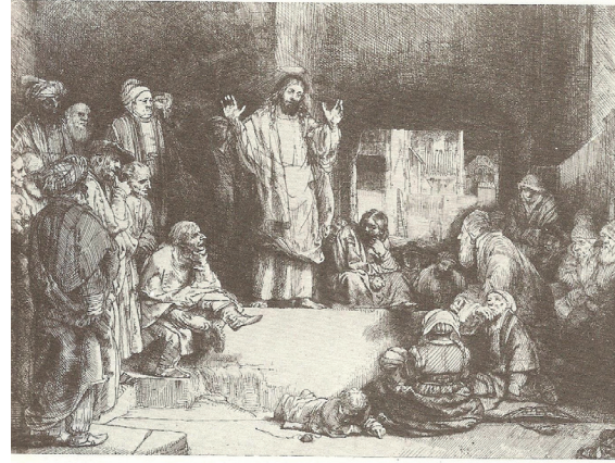
Resim 9. Rembrandt "İsa'nın Dinsel Öğütü" Asit oyma, 1652 dolayları