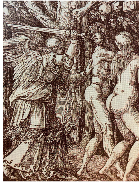
Kaynak: Grabowski, B & Fick, B (1999) Baskı Resim Çevirenler: S. Eskier & A. Tunç, İzmir: Karakalem Kitabevi Yayınları, 75

Rönesans döneminde, oyma islerini yapan zanaatkarlar vardır. Dürer’in deseninin tam ve doğru kopyasını ağaç blok üzerine çizip, oymak uzun bir tecrübe ve kayda değer bir ustalık gerektirir. Bu nedenle de Dürer desenini direk ağaç blok üzerine kendisi çizmiş ve genelde armut ağacını tercih etmiştir. Böylece yanlış, hatalı transfer olasılığını önlemiştir. Çok sayıda ağaç baskılarını kendisi oymaz. Bunun için bu konuda uzmanlaşmış zanaatçılardan yararlanmıştır.