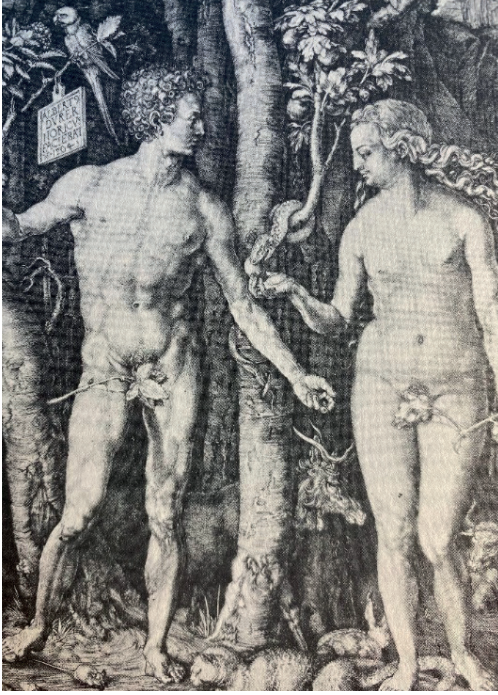
Resim 8. Dürer, Adem ve Havva, 1504, Bakır

Kaynak: Gombrich, E. H. (1986) Sanatın Öyküsü. Çeviren: B. Cömert, İstanbul: Remzi kitabevi, 267