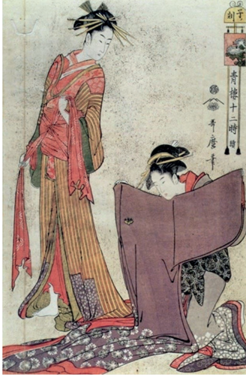
Resim 4. Utamaro- “ Japonya’nın Red Light’ı” (Japon tahta baskı)