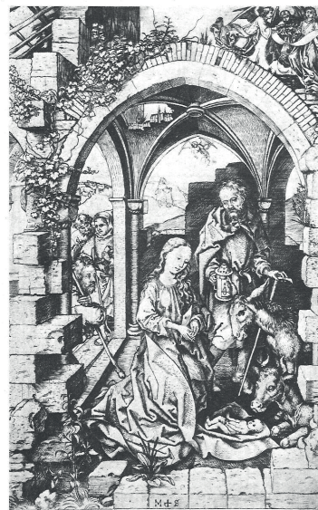
Resim 7. Shongauer, İsa'nın Doğuşu, Oyma Resim, Bakır üzerine soğuk kazı, 1475 dolayları

Kaynak: Gombrich, E. H.(1986) Sanatın Öyküsü. Çeviren: B. Cömert, İstanbul: Remzi kitabevi, 214