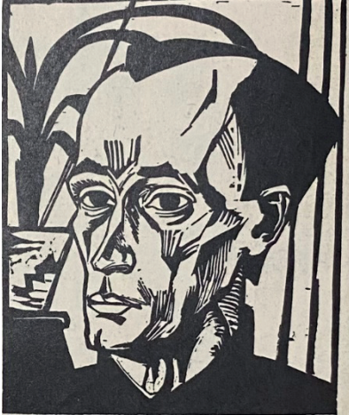
Resim 6. Erich Heckel, Kendi Portresi, 1917