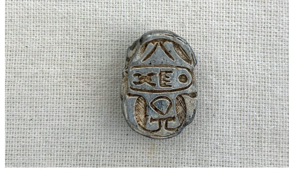
Resim 1. Mısır 18. Hanedanlığına ait mühür