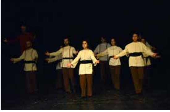
Resim 22. Selam Olsun, Giriş

Eser tamamlanırken, bu alemdeki yolculuğunun sonundaki Yunus bütün insanlara, acıyı tatlıya, umutsuzluğu umuda, ölümü yaşama çeviren selam olsun sözüyle (Eyüboğlu, 2005: 6) seslenerek ebedi aleme girişini kutlamaktadır. Selam Olsun şarkısına eşlik eden oyunun final koreografisinde, bahsedilen kavuşma ve kutlama halinin sırayla iki şekilde yansıtılmasına karar verilmiştir. Sahnenin başlangıcındaki koreografi bu kutlamaya davet niteliğinde ele alınmış, gövdenin açılıp kapanması motifine kollar eklenerek uzatmalı zamanlamada, sınırlandırılmış akışta ve çember formunun bir çeşitlemesi olan yarım ay düzeninde, Unison gerçekleştirilmiştir. Şarkının yarısından sonra, ebediyete varışın kutlanması halini en iyi ifade edecek motifin sema temasıyla ilişkili dönme eylemi olacağı düşünülmüş, yarım ay düzeninde yerleşen oyuncuların ortasında bir oyuncunun dönerek sema etmesine, eş zamanlı olarak diğer oyuncuların da buldukları noktada teker teker dönerek bu eyleme katılmalarına karar verilmiştir. Dönme eylemi LHA'ne göre özgür akışta ve hafif ağırlıkta gerçekleşmektedir.