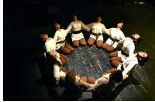
Resim 16. Sen Derviş Olamazsın

için şiir boyunca, 2. epizottaki gibi, nefes sesinin tekrar etmek suretiyle öne çıkartılmasına karar verilmiştir. Bu bölümde kullanılan tek motif, dizlerin üzerinde otururken göğüs bölgesinin açılıp kapanmasıdır. LHA'nde hem uzatmalı hem de ani zamanlamaya sahip olan ve direkt yönde gerçekleşen eylemler, küçük çemberde, kol kola, şiirin sözleriyle bire bir uyumlanmış zamanlamada gerçekleştirilir. Kullanılan kompozisyon araçları, Unison ve tekrardır.