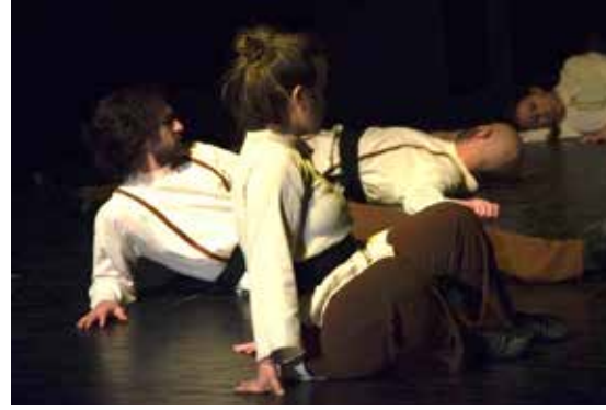
Resim 21. Bana Seni Gerek

Motifler doğaçlama gerçekleştirilirken oyuncular arasında etkileşimlere açık bırakılmıştır. Bu bölümdeki erime motifi, LHA'nde tüm efor kâlitelerini içinde barındırmaktadır.