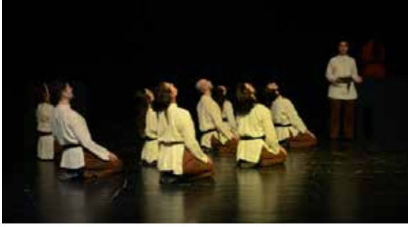
Resim 3. 2. Epizot

aktaracağı düşünüldüğü için, ilk epizotun tamamında sadece yürüme eyleminin kullanılmasına karar verilmiştir. Unison uygulanan yürüme, LHA'nde uzatmalı zamanlama ve sınırlı akışta, sahnede arkadan öne doğru bir zemin deseninde gerçekleşmektedir.