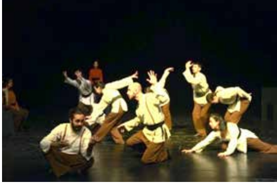
Resim 11. 8. Epizot

8. epizota gelindiğinde kaderine kafa tutan, kahırları yenen, zehri bala çeviren Yunus anlatılmaktadır (Eyüboğlu, 2005: 25). Koreografide, kişinin yolculuktaki zor, yalnız zamanlarında, direktme ve yenilenme gücünü zikrin desteğiyle tekrar içinde bulmasını betimlemek için, zikir teması ile ilişkili gövdenin açılıp kapanması motifinin kullanılmasına karar verilmiştir. Oyunculara, bu motifi kolları dahil ederek çeşitlendirmeleri ve seviye değiştirerek anlatıcının olduğu bölgeye doğaçlama bir şekilde ilerlemeleri yönergesi verilmiştir. Sahnede yönerge dahilinde doğaçlamaya açık bırakılmış eylemler, LHA'nde tüm efor kalitelerini içinde barındırmaktadır.