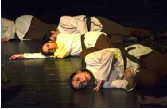
Resim 20. 12. Epizot

12.epizotun koreografisinde, insanlığın özünü yansıtan dost sözcüğünün içinde eriyip yok olma halinin ifade edilmesi için oyunculara, anlatım boyunca sadece bir kez, erime motifi ile buldukları yerden en alçak seviyeye geçiş yaparak yere yatma yönergesi verilmiştir. Koreografinin tek motifi olan erime, LHA'nde uzatılmış zamanlamada ve dolaylı yönde uygulanmaktadır. Hareketler motif çerçevesinde doğaçlamaya açık bırakılmıştır.