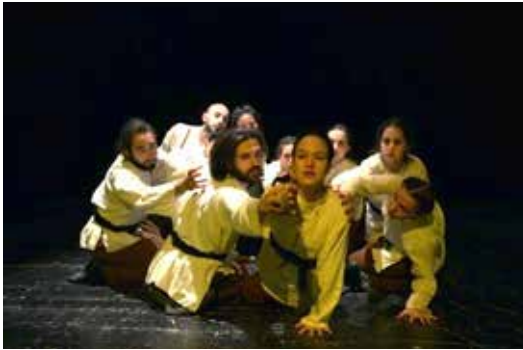
Resim 15. 10. Epizot

Yunus Emre Sen Derviş Olamazsın şiiriyle dervişliğin, kötü söze karşılık vermeyecek kadar gönülden ve nefsten arınıp kendini tamamen birliğin okyanusuna teslim etmeden mümkün olmayacağını açıkça dile getirmektedir. İnsanın nefsinden arınmasının zikir teması çerçevesinde kuvvetli bir şekilde ifade edileceği düşünüldüğü