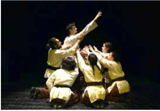
Resim 14. 10. Epizot

10. epizotta , dervişlerin sevgi ve hoşgörü çerçevesinde anlatılan insan üstü güçlerinin yanında, her insan gibi, içlerinde birer canavar beslediğini söyler Yunus (Eyüboğlu, 2005: 46-47). 10. epizodun koreografisinde, nefsin terbiye yolculuğu esnasında kişinin beslediği canavarlar ile birlik bilinci arasında gidip gelen içsel mücadelesi öne çıkartılmak istenmiştir. Koreografi, çemberde hareketsiz oturan oyuncuların, teker teker aniden dışarı uzanmaları ve diğer oyuncuların dışarı uzanan oyuncuyu kollarını uzatarak çembere geri döndürmeleri eylemlerinin tekrar edilmesinden oluşmaktadır. 10. epizotta gövdenin açılıp kapanması motifi çeşitlenerek çemberin açılması ve kapanması olarak ele alınmıştır. LHA'nde direkt yönde uygulanan eylemler, ani zamanlamayı içerir. Zamanlama ve hareketler yönerge dahilinde doğaçlamaya açık bırakılmıştır.