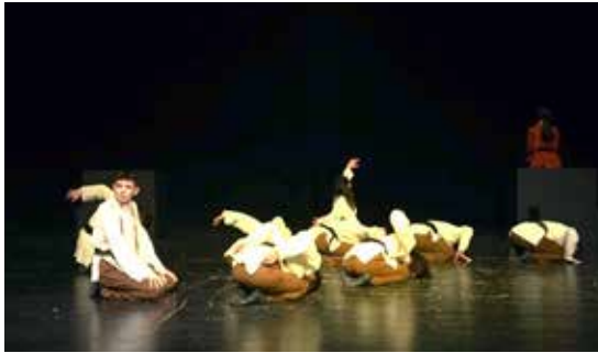
Resim 4. 3. Epizot, 1. bölüm

2. epizot ile hem metinde hem de koreografide Yunus'un seferinin başlangıcına giriş yapılmaktadır. Bu bölümde, Yunus'un yolculuğu için belki de en önemli dönüm noktası olan Hacı Bektaş Veli ile tanışması anlatılmaktadır. Bu tanışıklıkta Hacı Bektaş'ın Yunus'a sunduğu nefesin önem arz etmesi neticesinde koreografide esas olarak nefes sesinin tekrar etmek suretiyle öne çıkartılmasına karar verilmiştir. 2. epizotta Unison kompozisyon aracı ile kullanılan motif, dizlerin üzerinde otururken gövdenin açılıp kapanmasıdır. LHA'nde hem uzatmalı hem ani zamanlamaya sahip olan ve direkt yönde gerçekleşen eylemler, sahnenin ortasında kendi ekseninde dönerek uygulanmaktadır. Sahnede anlatıcı hariç oyuncuların konumları değişmemiş, öne dönük başlayan hareketler sol arka köşeye dönülerek tamamlanmıştır. Oyuncuların aynı anda aynı köşeye dönebilmeleri için Laban Hareket Analizi'den yararlanılmıştır.