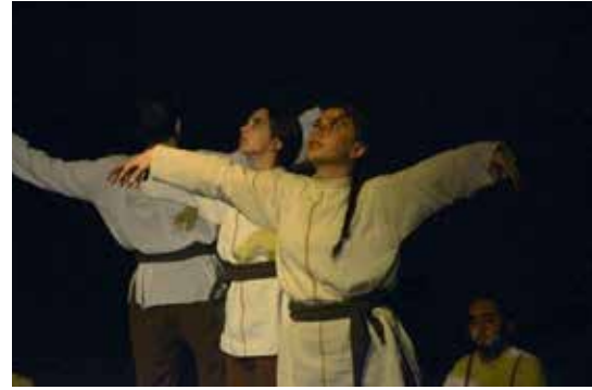
Resim 19. Severim Ben Seni, Oyuncular

Severim Ben Seni ilahisi, manevi sefer esnasında insanın gözündeki perdenin kalkarak fiziksel aleme dayalı bildiklerinden öteye geçmesini ve kendi içinde var olan ilahi aşkın özüne yaklaşmasını anlatmaktadır. Bu yüzden, zikir temasına geri dönülerek koreografinin tekrar kompozisyon aracı ve gövdenin açılıp kapanması motifinden oluşmasına karar verilmiştir. Ayrıca, bütünlüğü temsil etmesi için sahnede çember formu oluşturulmuştur. Çember formunda oturarak gövdelerini açıp kapayan oyuncuların ortasında bir oyuncu, ayakta ilerleyerek ve kollarını eyleme dahil ederek aynı motifi uygulamaktadır. Grupta hareketler Unison gerçekleştirilmektedir. Zamanla, meclislerde ilahinin ritmiyle coşarak semaya kalkan kişileri betimlemek üzere bazı oyuncular çemberin içinde ayaktaki oyuncuya katılırlar. Eylemler, LHA'nde hem uzatmalı hem de ani zamanlamayı içermekte, direkt yönde ve özgür akışta uygulanmaktadır.