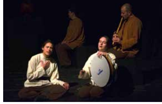
Resim 18. Severim Ben Seni, Müzisyenler

11. epizodun devamı olan bu bölümde, Yunus'un aşkı yaşarken cesur olduğu, kendi aşkıyla yetinmek yerine dünyanın üstüne yürümeyi seçtiği anlatılmaktadır (Eyüboğlu, 2005: 31). Bu kısa anlatımın koreografisinde, her oyuncunun aşkın gözünün içine bakıp yiğitçe ortaya atılan ve dünyanın üstüne cesaretle yürüyen bir Yunus olduğu fikri temel alınmış, tüm oyuncuların, anlatıcının çevresinde karışık bir düzende ve anlatıcıya bakarak yürümlerine karar verilmiştir. Bu bölümün tek motifi olan yürüme eylemi, LHA'nde özgür akışta ve dolaylı yönde gerçekleşmektedir.