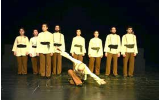
Resim 9. 7. Epizot

Metnin ikinci şiiri, tüm bilgilerin, her şeyden önce insanın kendisini bilmesi için var olduğunu söyleyen İlim İlim Bilmektir şiiridir. Bu bölümde hem Yunus'un içe doğru yaptığı yolculuğu hem de insanın kendini bilmeye doğru attığı adımları temsil etmesi için şiir boyunca oyuncuların normal bir hızda, karışık düzende ve doğaçlama olarak yürümelerine karar verilmiştir. Kendini bilen kişinin dünyaya samimiyetle açılmasını betimlemek üzere oyuncular tüm mekanı kapsayacak şekilde yürümektedirler. Burada yürüme motifi, LHA'nde özgür akışta, hafif ağırlıkta ve tüm yönlerde gerçekleşmektedir. Gösteride motif dahilinde doğaçlama yöntemi kullanılmıştır.