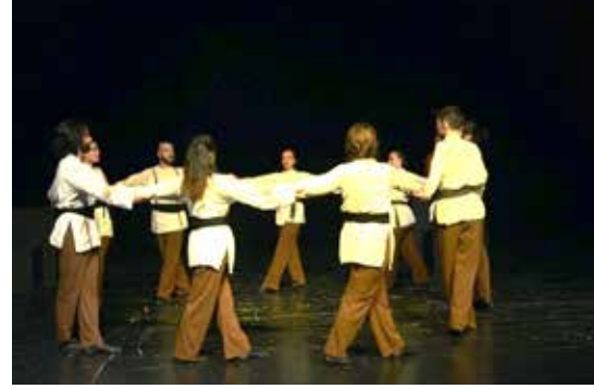
Resim 10. Gelin Tanış Olalım

Yunus, birbirimizi sevgi yoluyla anlamamız, tanımamız, birbirimizin varlığını kabul etmemiz ve işbirliği yapmamız gerektiğini söyler bize Gelin Tanış Olalım şiiriyle. Bu sonsuz sevgi ve birlik yolculuğunu ifade etmek üzere şiir okunurken oyuncuların bir önceki bölümün sonunda el ele tutuşarak oluşturduğu çemberin yürüyerek sola doğru döndürülmesine ve bu dönüşün kademeli olarak hızlandırılmasına karar verilmiştir. Bu bölümdeki tek motif olan çember formundaki yürüme,