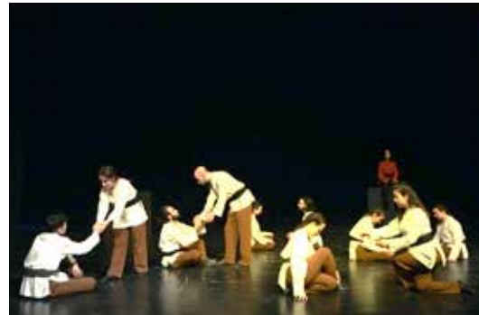
Resim 13. Miskinlikte Buldular (Dört Kitabın Manası)

Birliği, eşitliği ve herkesin aynı yolun yolcusu olduğu fikrini öne çıkaran Miskinlikte Buldular (Dört Kitabın Manası) şarkısının koreografisinde, önceki bölümdeki gibi sevginin saflığını ve birlikteliği ifade etmek üzere yalın bir anlatım kullanılmasına karar verilmiştir. İkili gruplarda gerçekleşen koreografi, elini uzatıp diğerini yerden kaldırma, birlikte mekanın farklı bir noktasına doğru yolculuk ettikten sonra el ele tutuşup aynı anda eriyerek yere oturma eylemlerinin aralarda durağanlıklarla tekrar edilmesinden oluşmaktadır. Eylemler LHA'nde hem sınırlandırılmış hem de özgür akışı barındırırken hem hafif hem de ağır kalitelerde ve direkt yönde gerçekleşmektedir. Bu ilahi, erime imgesinin çeşitlenerek ağır bir şekilde ve direkt yönde kullanıldığı tek bölümdür. Koreografi, yönergeler dahilinde doğaçlamaya açık bırakılmıştır. Tüm mekan kullanılmaktadır.