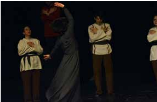
Resim 23. Selam Olsun, Final

Eser tamamlanırken, bu alemdeki yolculuğunun sonundaki Yunus bütün insanlara, acıyı tatlıya, umutsuzluğu umuda, ölümü yaşama çeviren selam olsun sözüyle (Eyüboğlu, 2005: 6) seslenerek ebedi aleme girişini kutlamaktadır. Selam Olsun şarkısına eşlik eden oyunun final koreografisinde, bahsedilen kavuşma ve kutlama halinin sırayla iki şekilde yansıtılmasına karar verilmiştir. Sahnenin başlangıcındaki koreografi bu kutlamaya davet niteliğinde ele alınmış, gövdenin açılıp kapanması motifine kollar eklenerek uzatmalı zamanlamada, sınırlandırılmış akışta ve çember formunun bir çeşitlemesi olan yarım ay düzeninde, Unison gerçekleştirilmiştir. Şarkının yarısından sonra, ebediyete varışın kutlanması halini en iyi ifade edecek motifin sema temasıyla ilişkili dönme eylemi olacağı düşünülmüş, yarım ay düzeninde yerleşen oyuncuların ortasında bir oyuncunun dönerek sema etmesine, eş zamanlı olarak diğer oyuncuların da buldukları noktada teker teker dönerek bu eyleme katılmalarına karar verilmiştir. Dönme eylemi LHA'ne göre özgür akışta ve hafif ağırlıkta gerçekleşmektedir.