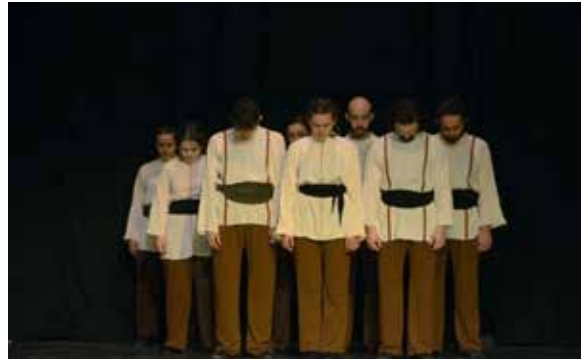
Resim 2. 1. Epizot

Aşağıda koreografi unsurlarının gösterinin 6 şiir ve 6 ilahi/şarkı içeren 13 epizodunda nasıl işlendiğinden bahsedilmektedir. İncelemelerde Laban Hareket Analizi (LHA) bağlamında sadece öne çıkan öğelere yer verilmiştir.