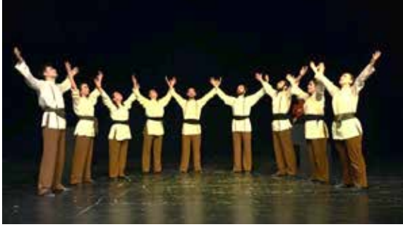
Resim 7. Haktan Gelen Şerbeti

ografi için oyunculara erime imgesiyle yükselip alçalarak spontane poz (duruş) değişimi yapmaları ve pozlarda belli bir süre durağan kalmaları yönergesi verilmiştir. Ayrıca epizodun sonunda oyuncuların, metinle uyumlu olacak şekilde, eriyerek yere yatmalarına karar verilmiştir. Bu yönergeler, taşınan odunların yıllar içinde yavaş yavaş, belirsizce nefsi eğitmesine ve nihayetinde nefsin teslim olmaya geçişine bir gönderme yapması için tercih edilmiştir. Durağan anları yoğunlukla içeren 4. epizotta kullanılan tek motif, çeşitli biçimlerde erimedir. LHA'nde uzatmalı zamanlamaya ve sınırlandırılmış akışa sahip olan bu eylem, oyuncuların sahnede oluşturulmuş diyagonal yerleşimdeki noktalarında sabit kalacakları şekilde, yönergeler çerçevesinde doğaçlama gerçekleşmektedir. Anlatıcı, oyuncuların arasındaki boşluklarda ilerlemektedir.