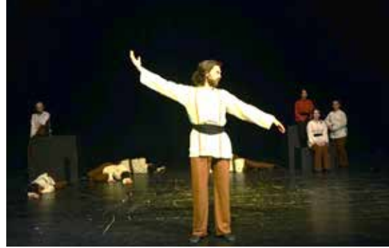
Resim 8. 6. Epizot

Oyunda seslendirilen ilk şiir olan Çağırayım Mevla'm Seni şiirde hem Yunus'un Mevla'ya yakarışının hem de Mevla'ya teslim olma yolundaki bireyi tasvir etmek üzere oyuncular, teker teker, oturdukları yerden ayaklarının üzerine yükselirler. Şiirde kullanılan hareket motifleri eriyerek yükselmez. LHA'ndeki zamanlaması uzatmalı, mekanı ise yarım ay düzeninde sabittir.