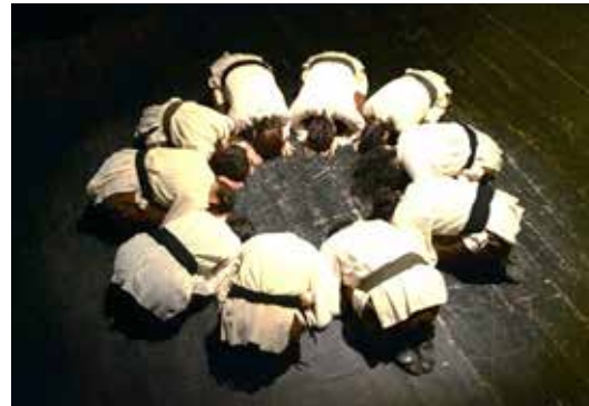
Resim 17. Bize Didar Gerek

Yunus bu aleme, dünyevi meselelerle uğraşmaya değil ilahi aşk yolunda vuslata ermeye geldiğini Bize Didar Gerek şiiriyle dile getirir. Bu da yeniden ilahi aşkla dolu bir teslimiyet haline taşır bizi. Oyunun sonuna doğru yaklaşırken, nefsin yüklerinden arınmış bir şekilde, aşk ve birlik bilincinin verdiği huzur ile dolma halini yansıtmak ve şiirin manasını öne çıkartmak amaçlandığı için oyuncuların, tüm şiir boyunca, küçük çemberde, kol kola, secde pozisyonunda ve hareketsiz bir şekilde durmalarına karar verilmiştir. Bu şiir koreografideki tam durağanlığın kullanıldığı 3. bölümdür.