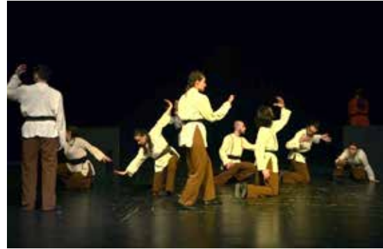
Resim 5. 3. Epizot, 2. bölüm

anlatılmaktadır. Birinci hikayede, Hacı Bektaş'ın Anadolu'ya güvercin kılığında gelmesinden alınan ilhamla oyunculara, aynı anda, hem doğacak kuş hem de onun kıracağı yumurta oldukları imgesi ile doğaçlama hareket etmeleri söylenmiştir. 3. epizodun birinci kısmında kullanılan motif, dizlerin üzerinde otururken gövdenin açılıp kapanmasıdır. LHA'nde, hem uzatmalı hem ani zamanlamaya sahip bu kısım mekanda sol arka köşeye dönük, sabit bir noktada gerçekleşmektedir. Taptuk Emre'nin hikayesinin anlatıldığı ikinci kısım için Hacı Bektaş'ın Taptuk'a uzattığı el ilham kaynağı olmuş, oyunculara çeşitli biçimlerde ve seviyelerde ellerine bakarak ilerleme yönergesi verilmiştir. Burada gövdenin açılıp kapanması motifine kollar eklenerek çeşitlenmiştir. Yönergeler çerçevesinde doğaçlama gerçekleşen ve tüm efor kalitelerini içinde barındıran eylemler sahne sol arka köşeden sahne sağ ön köşeye uzanan diyagonal bir yerleşime doğru ilerlemektedir.