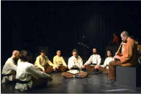
Resim 12. Gel Gör Beni

8. epizota gelindiğinde kaderine kafa tutan, kahırları yenen, zehri bala çeviren Yunus anlatılmaktadır (Eyüboğlu, 2005: 25). Koreografide, kişinin yolculuktaki zor, yalnız zamanlarında, direktme ve yenilenme gücünü zikrin desteğiyle tekrar içinde bulmasını betimlemek için, zikir teması ile ilişkili gövdenin açılıp kapanması motifinin kullanılmasına karar verilmiştir. Oyunculara, bu motifi kolları dahil ederek çeşitlendirmeleri ve seviye değiştirerek anlatıcının olduğu bölgeye doğaçlama bir şekilde ilerlemeleri yönergesi verilmiştir. Sahnede yönerge dahilinde doğaçlamaya açık bırakılmış eylemler, LHA'nde tüm efor kalitelerini içinde barındırmaktadır.